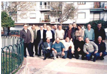
Equipo Mastia – Cartagena Campeón Regional 1998 4º Campeonato España 1998

En Diciembre (1998), también en Loja, se disputa el IV Campeonato de España por Equipos donde nos representa el Campeón Regional, MASTIA de Cartagena, que tras un buen campeonato obtiene el 4º puesto tras LA PEÑA EL SOMBRERO (Málaga), TOSCAL TOURLINE EXPRESS (Tenerife) y RESTAURANTE ANGELIN (Alicante).