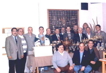
Equipo San Remo – 1996 Subcampeón de España

La nueva Asociación comienza su andadura y programa el I Campeonato “Asociación Cartagenera de Dominó” a celebrar de Mayo a Julio del 1997; pero este Campeonato produce un retroceso en nuestro desarrollo; una desafortunada gestión económica unida a la falta de un local propio hace pasar a la Asociación por una situación crítica.