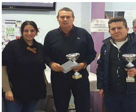
SUBCAMPEONES - B