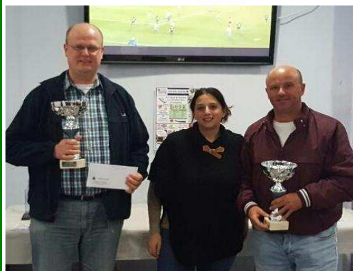
CAMPEONES - B